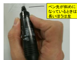
ペンの両脇に指を置く