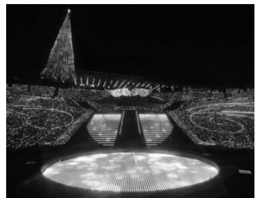
※昨シーズンの画像です。

発売日 10月3日(月)から共済会窓口販売。売り切れ次第終了。 料金 1枚400円 (通常大人3,300円、3歳から小学生以下2,800円 のところ) 販売枚数 170枚(会員1人4枚まで) 利用期間 平成29年3月31日まで 利用内容 入園・アトラクション乗り放題(一部不可) 西武園ゆうえんち ☎04-2922-1371