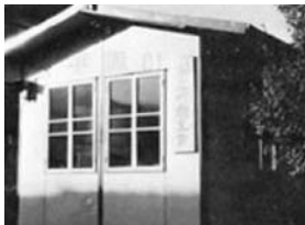
(現在の国立市中一丁目)