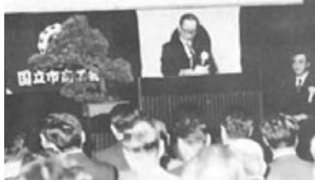
(狭小を解消して相談、研修、会議に対応)