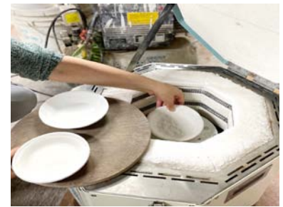
今回購入した小型窯

この取組みを通じてコロナ禍でも一定の売上を確保することができ、コロナ前と比較しても117%の売上を達成することが